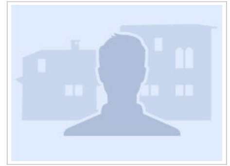
Montse y Margarita

★★★★ _ Bewertet von: Wolfgang am 01.10.2019